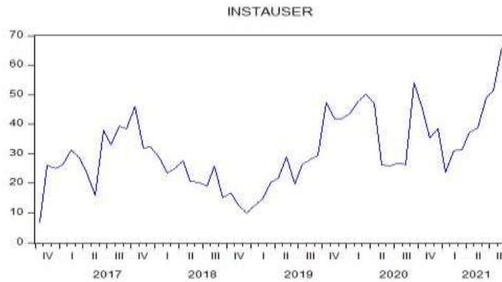
نمودار ۱. درصد کاربران اینستاگرام در ایران از ماه اکتبر ۲۰۱۶ تا اوت ۲۰۲۱