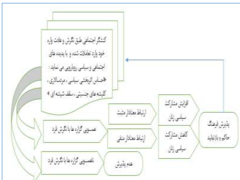
شکل ۳. نتیجه‌گیری

اجتماعی را پدید می‌آورند و در صورت ناهمسوایی و مغایرت بین نگرش و پدیده اجتماعی، آن را رد می‌کنند و نمی‌پذیرند و بعضاً در مواجهه اجباری، به جرح و تعدیل آن می‌پردازند.